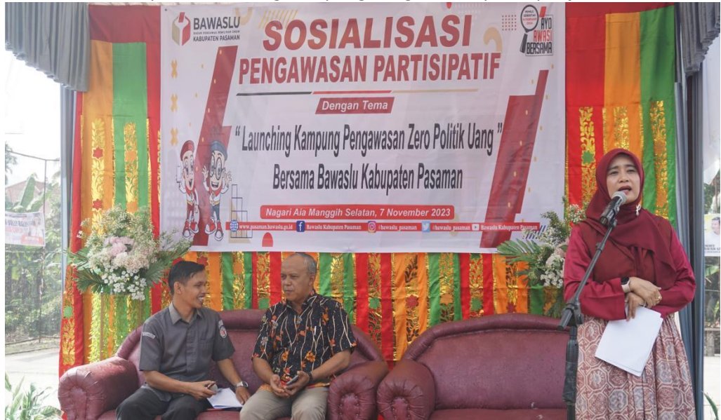
Gambar 2.2 Sambutan pada Launching Kampung Pengawasan partisipatif