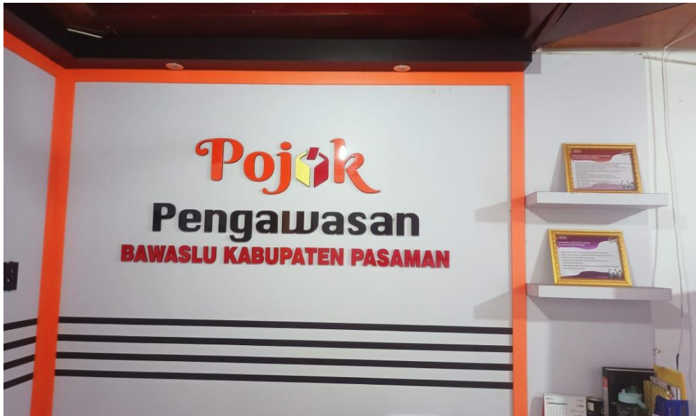
Gambar 2.4 Pojok Pengawasan Bawaslu Pasaman

Bawaslu kabupaten Pasaman juga sudah memiliki pojok pengawasan yang bermanfaat bagi mahasiswa ataupun Masyarakat dalam menambah ilmu.terkait kepemiluan karena tersedia buku buku serta laporan Pengawasan pemilu dan pilkada yang berguna bagi mahasiswa dalam menyelesaikan tugasnya ataupun Masyarakat.