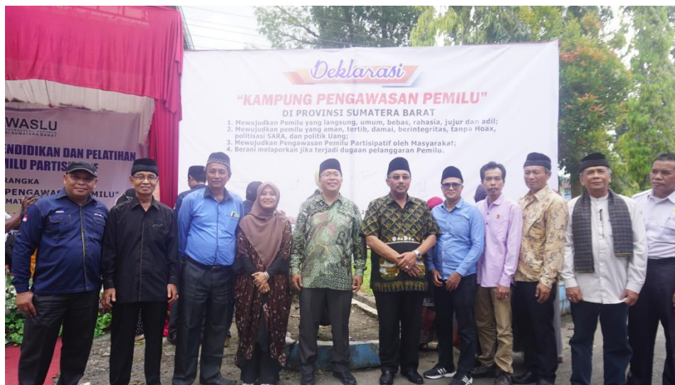
Gambar 2.3 Sambutan pada Launching Kampung Pengawasan partisipatif